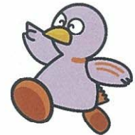
埼玉県 マスコット コバトン