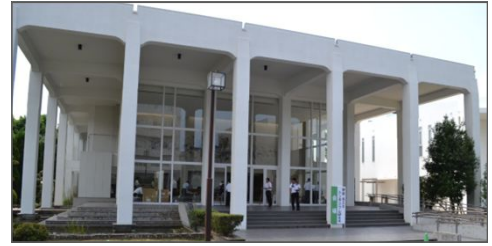
長崎大学医学部記念講堂

[お問合せ先] ながさき健康・省エネ住宅推進協議会事務局 ☎ 0957-26-3217