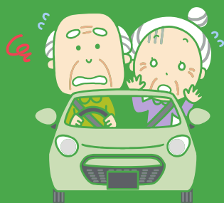
交通事故死亡者数

2018.09.23(sun) 和歌山県民のための ヒートショック を防ぐための講座