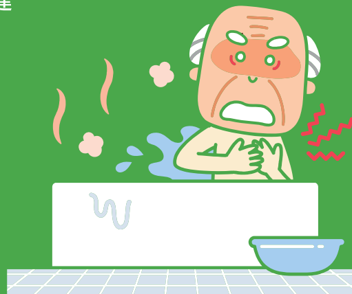
ヒートショック死亡者数