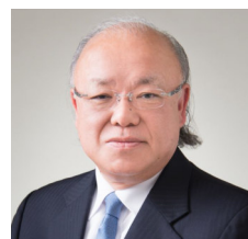
新潟県見附市 市長 久住 時男氏

1949年新潟県見附市生まれ。2002年見附市長就任。2004年の7月豪雨災害、同年10月の中越大地震と2度の激甚災害の経験を踏まえ、講演活動などを通し、防災・減災について積極的に全国へ発信している。超高齢・人口減少社会を克服するべく「スマートウェルネスシティ首長研究会」を立ち上げ会長を務める。また産官学が一体となり、健康長寿社会の実現を目指す組織「スマートウェルネスコミュニティ協議会」の発足に携わり、健康長寿推進員・人材育成分科会の副会長に就任。Smart Wellness City首長研究会会長。筑波大学客員教授。スポーツ審議会スポーツ基本計画部会臨時委員、等々歴任。