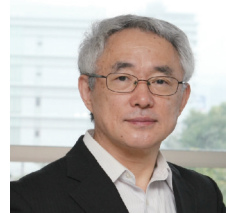
首都大学東京 名誉教授 星 旦二氏

1949年新潟県見附市生まれ。2002年見附市長就任。2004年の7月豪雨災害、同年10月の中越大地震と2度の激甚災害の経験を踏まえ、講演活動などを通し、防災・減災について積極的に全国へ発信している。超高齢・人口減少社会を克服するべく「スマートウェルネスシティ首長研究会」を立ち上げ会長を務める。また産官学が一体となり、健康長寿社会の実現を目指す組織「スマートウェルネスコミュニティ協議会」の発足に携わり、健康長寿推進員・人材育成分科会の副会長に就任。Smart Wellness City首長研究会会長。筑波大学客員教授。スポーツ審議会スポーツ基本計画部会臨時委員、等々歴任。